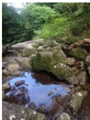
※ツアーではふもとでボイスヒーリングします